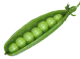
इयं का? इयं शिम्बा।