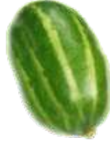
अयं कः? अयं पटोलः।