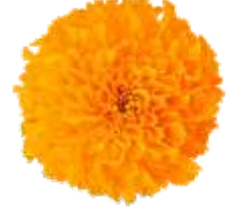
इदं किम्? इदं स्थलपद्मम्।