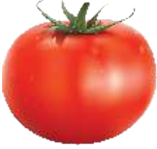
अयं कः? अयं रक्ताङ्गः।